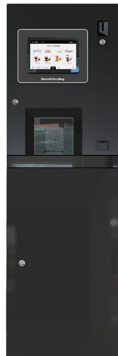
DAILY S + mobiletto

DAILY S è il distributore automatico con capacità di 250 bicchieri